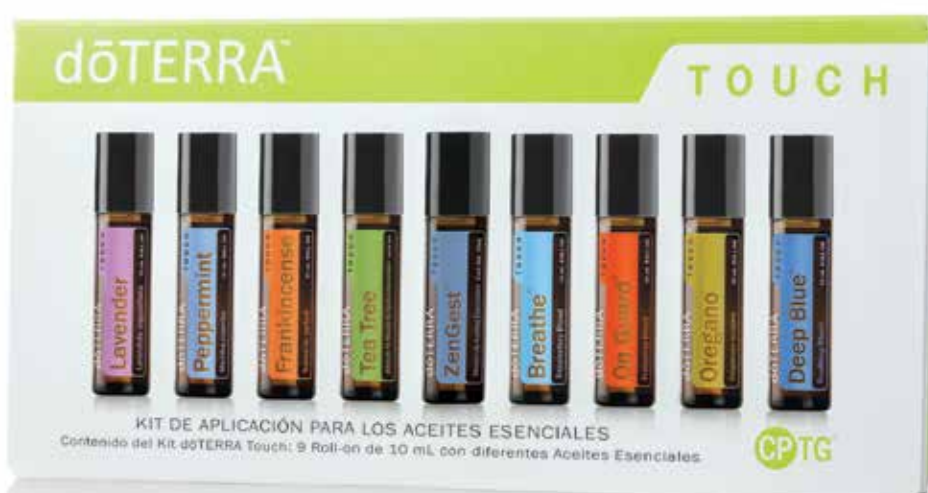
Kit dōTERRA Touch®

Lograr el equilibrio adecuado entre la protección de la piel sensible y seguir ofreciendo los beneficios que se encuentran en los aceites esenciales no es solo una cuestión de ciencia, sino también de arte. dōTERRA Touch ha logrado ese equilibrio. Con nueve de nuestros aceites más populares en una base de Aceite de Coco Fraccionado, dōTERRA Touch hace sencilla la aplicación con rolón de 9 mL. Están listos para usarse, para que puedas empezar a beneficiarte de los aceites esenciales de inmediato. Disfruta de la comodidad y los beneficios de dōTERRA Touch.